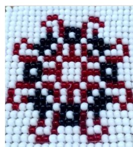
Фото 8,9: Зашифрованное имя Егор: схема и магнит из бисера, выполненные учащимся объединения по интересам Качаном Егором