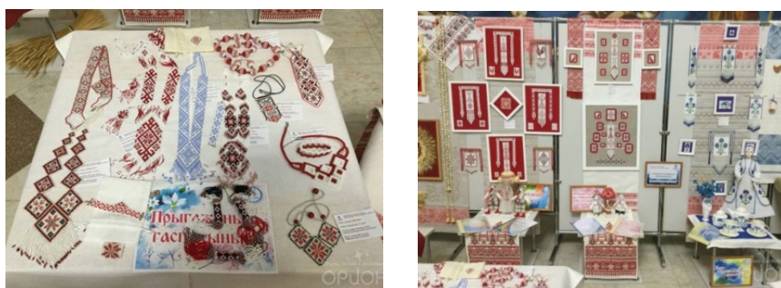
Фото 4, 5: Работы учащихся объединения по интересам «Искусство бисера. Традиции и современность», представленные на фестиваль народного творчества «Сузор'е».

художественный образ творческой композиции, изготавливать изделия по собственному замыслу. Детские произведения, создаваемые в объединении по интересам, выражают собой индивидуальные достижения детского творчества. И, конечно, ребенку важно интересно и успешно их представить. Этому способствует участие в конкурсах декоративно-прикладного творчества. С изделиями в белорусском стиле ребята принимают участие в выставках и конкурсах, таких как «Традиции и современность», «Калядная замалёўкі», «Калядная зорка», фестиваль народного творчества «Сузор'е» и др., где занимают призовые места (фото 4,5).