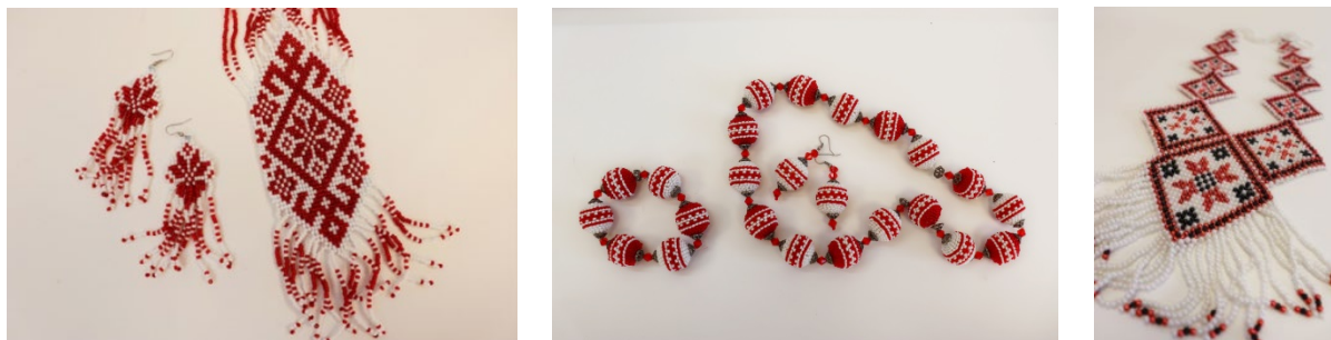
Фото 1,2,3: Изделия из коллекции «Прыгажунька гаспадынька»

выставка аксессуаров и интерьерных композиций «Зямля з блакітнымі вачамі – раздолле рэчак і лугоў».